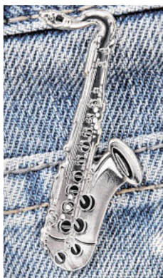
25 Jahre SummerJazz: Zum Silber-Jubiläum gibt es ein silbernes Tenorsaxofon als Pin.

Servicetipp: Um Senioren die Möglichkeit zu geben, auch ohne Internetzugang eine Reservierung für die Konzerte des SummerJazz-Festivals vom 5. bis 8. August vornehmen zu können, bietet Karl-Heinz Schack vom Seniorenbeirat Pinneberg an, dass interessierte Besucher bei ihm telefonisch eine Reservierung tätigen können, und zwar unter der Telefonnummer (04101) 781355.