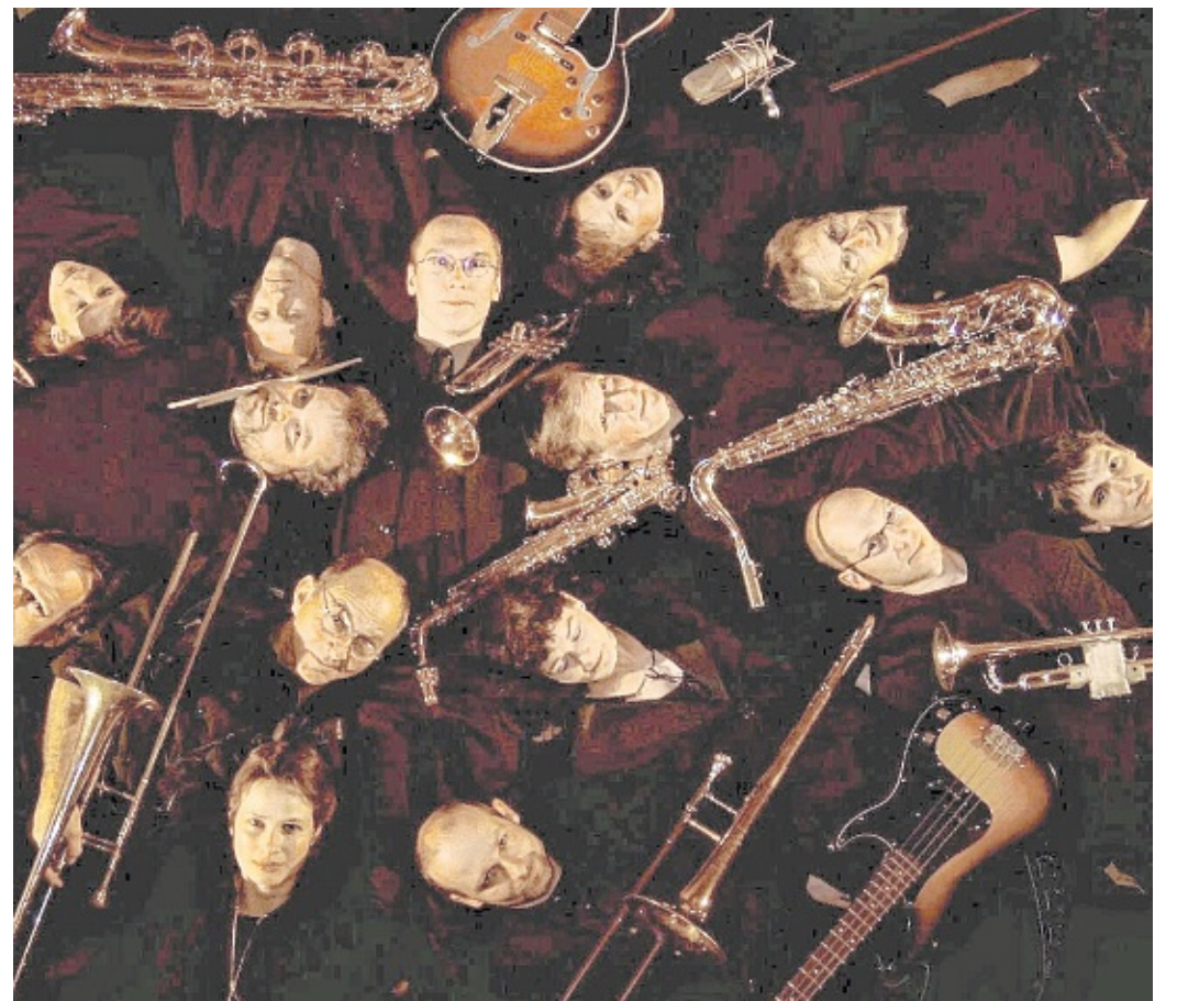
Schmetterndes Blech und swingender Sound: Die Bigband „Elms-Horns“.

Außer Bigband-Jazz haben die Musiker aber auch Rock, Pop, Latin und Swing im Programm. Im Ambiente des gepflegten Rosengartens kom-