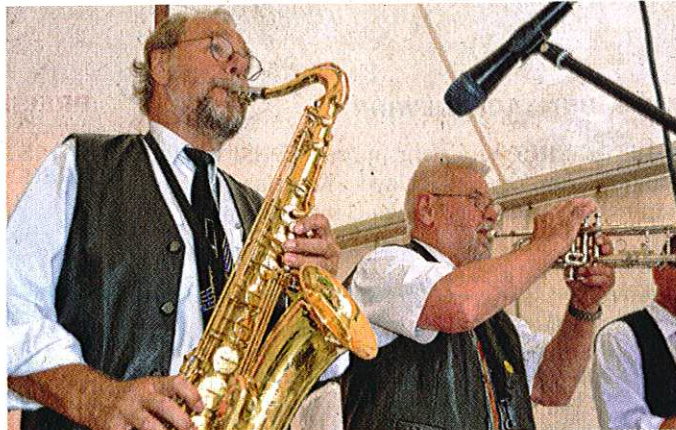
Die Limehouse Jazz Band legte gestern schon ab 18 Uhr im Fahltskamp los.

Mit der „Parklane Jazzband“ präsentieren ab 19 Uhr Stammgäste des SummerJazz ihren Swing in der Mitt-