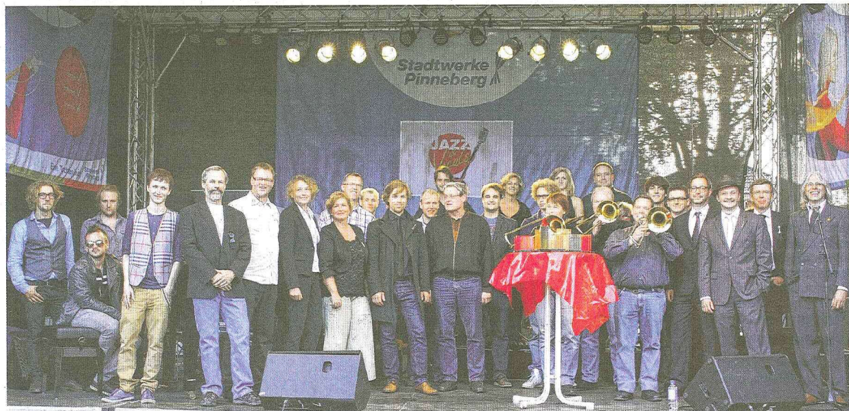
Preisverleihung gestern Abend um 19 Uhr: Contest-Gewinner, Festival-Macher und Sponsoren blicken auf ein erfolgreiches Festival zurück. VOG, AND, JUW, FKO