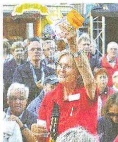
Pins zu verkaufen: Wer Jazz hören will, sollte zugreifen.

Nach der Halbzeit zog Hoffmann die erste positive Bilanz: „Es hat alles gut geklappt