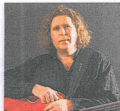
...sind loco de jazz.