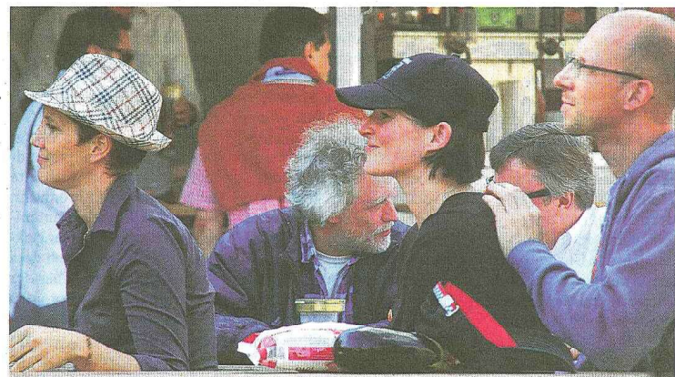
Gut behütet: Für die Konzentration auf die Musik gibt's so einige Hilfsmittel.