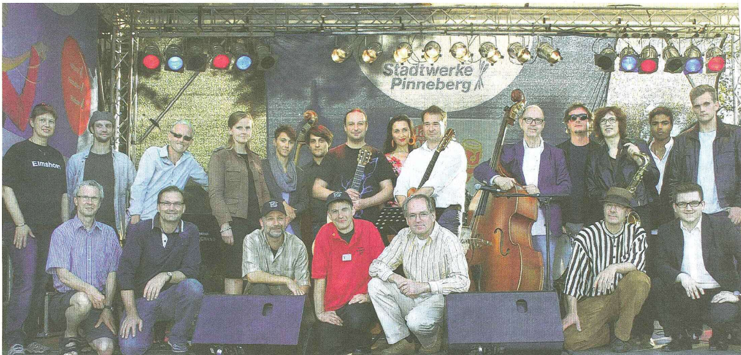
Höhepunkt am gestrigen Abend: Die Förderpreisträger des diesjährigen SummerJazz-Festivals genossen zum Abschluss noch einmal das Rampenlicht.