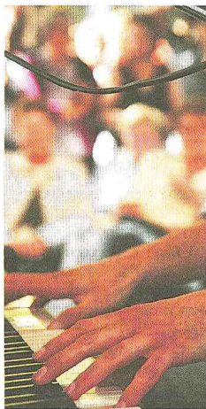
Fingerspiel: An Klaviervirtuosen gab es keinen Mangel.