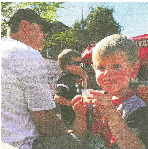
Lecker: Ein Eis in der Pause muss schon sein.