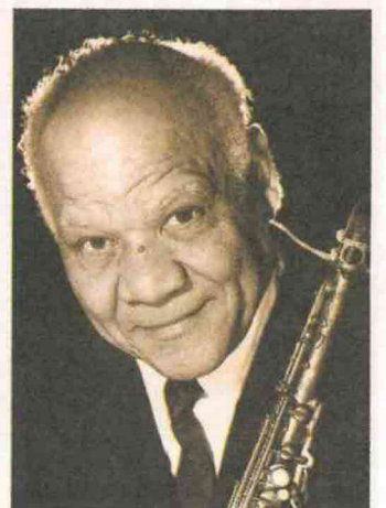
Mit der „Festival Night“ am Sonnabend wird Sopransaxophonist Sidney Bechet geehrt.