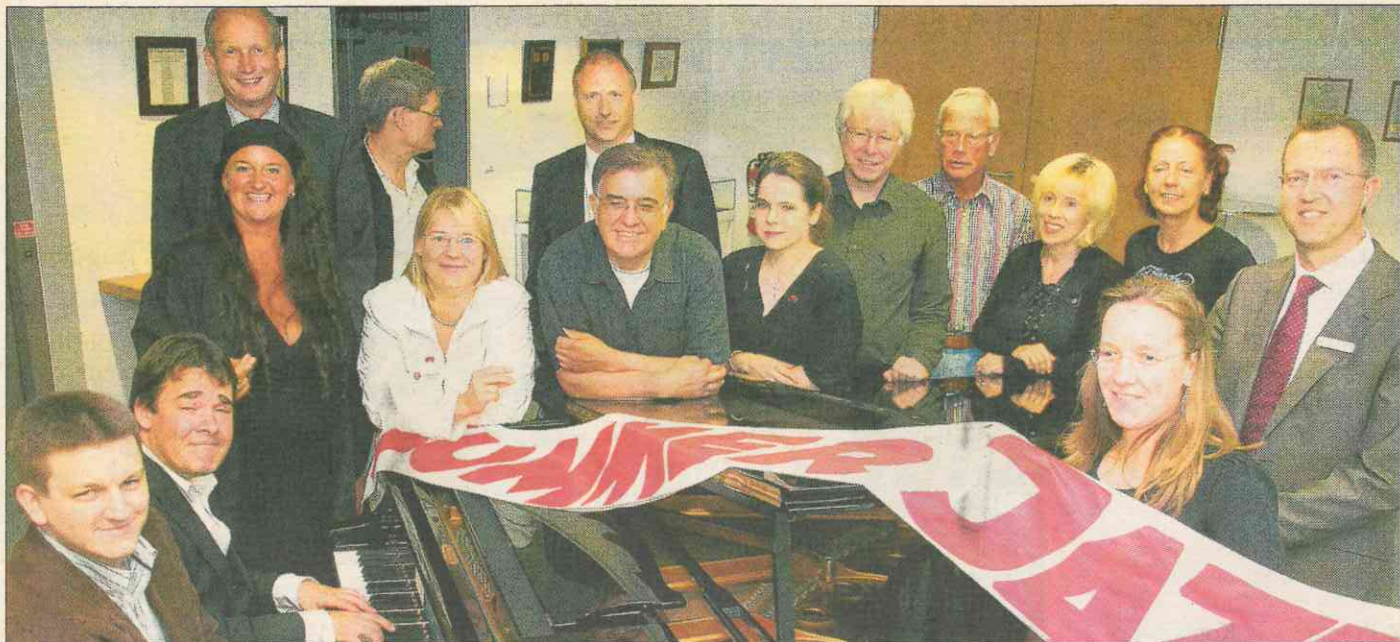
Die Sponsoren und Veranstalter des 14. SummerJazz-Festivals laden alle Musikfans zum Besuch der Kreisstadt ein.