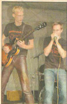
„Gutfürnkeller“ zeigten energetische Lieder mit frechen Texten.

Genre - „Piratenjazz“ - Jubelstürme unter den Zuschauern auslöste. Der verdiente Lohn: Die Hamburger Combo bekam am Sonntag den Förderpreis zugesprochen. Bei solch einem Nachwuchs muss sich wohl niemand um die Zukunft des Festivals Gedanken machen. Für Göllner steht fest: „Ich werde auch im nächsten Jahr wiederkommen“.